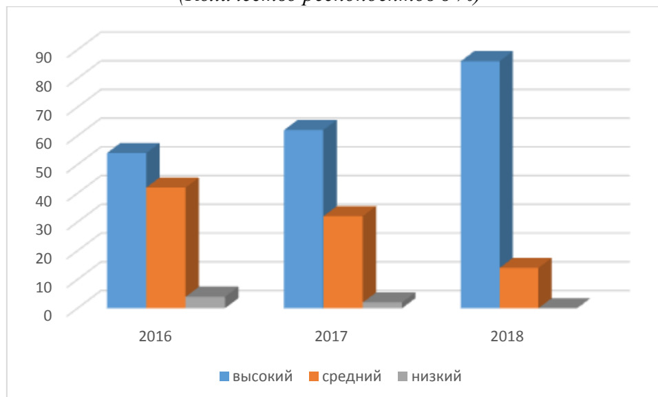
Рис.2. Удовлетворённость родителей работой ДОУ по приобщению детей к книге и чтению. Сравнительные данные на начальном и заключительном этапе (Количество респондентов в %)