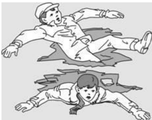
Попытки вылезти самому из полыньи грудью или спиной

Если вы провалились под лед, широко раскиньте руки, навалитесь грудью или спиной на лед и постарайтесь вылезти на него самостоятельно, зовите на помощь.